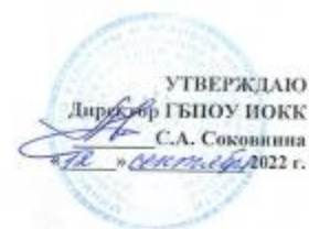
Календарный учебный график работы «Инструментальной студии «От и До» на 2022-2023 гг.